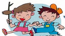
ひとりで遊ばない 1人でいるときに犯罪に巻き込まれやすい。できるだけ1人で遊ばないように指導する。

石川警察署管内では、最近児童・生徒への声掛け事案が増加しています。その殆どが下校時に「家まで送っていくよ」などと声をかけているようです。重大事件に繋がりにかぬない「声かけ事案」の被害防止のため、地域が一体となって児童・生徒の安全確保に努めましょう。