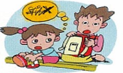
何かあったら必ず話す 危険な目に遭ったら「こんなことがあった」と必ず家の人に話すように言うておく。これには普段からのコミュニケーションが重要。