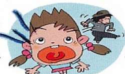
危険を感じたら大声で助けを呼ぶ