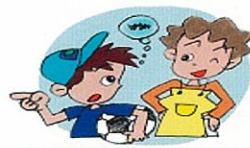
外出時に必ず行き先をいう 何も言わないで外出させない。「誰と」「どこで」「何をするか」「帰りは何時頃か」を必ず言うように習慣づける。