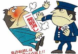
免許取消しは違反点数15点以上!!