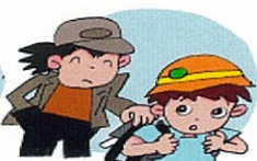
知らない人には絶対について行かない 知っている人でも「家の人に聞いてから」と言うようにする。また、車から声をかけられても絶対に近づかない。